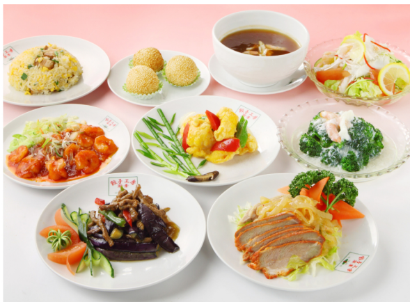
■写真は、3,480円コース ①前菜の盛り合わせ②ナスと牛肉のチリソース③イカのから揚げ④ブロッコリーの蟹あんかけ ⑤エビチリ⑥海鮮サラダ⑦ふかひれスープ⑧五目炒飯⑨ごま団子

翠葉にきたらやっぱり餃子を食べ ずに帰らないという方の為に コースご利用者は半額で用意!