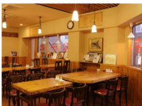
右: 広々とした店内で宴会を楽しめます!